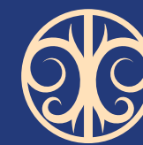
Insertion du projet dans le site